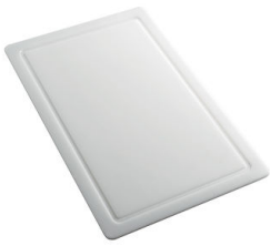
Tagliere in HDPE