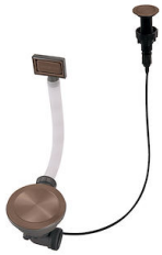
Piletta automatica Space Push Copper